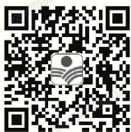
《作文周刊》报社公众号

恰当地使用修改符号，养成修改习作的良好习惯，是提高写作水平的重要环节。作为小学生，要学会自行修改习作，这是进行二次学习与思考的关键。在修改习作时，往往乱涂乱画，不但不整洁，修改一多，更易造成文字混乱。正确使用修改符号，是避免这种缺点的重要方法。在现阶段，使用较多的修改符号是：改正号，删除号，增补号，对调号。